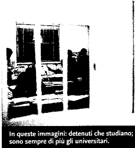
In queste immagini: detenuti che studiano; sono sempre di più gli universitari.

Un Polo universitario è un progetto cui collaborano atenei locali e amministrazione penitenziaria, un'università cui sono ammessi solo detenuti. Il primo è stato quello di Torino (1998, con un corso di Scienze politiche), che ha preso il via da un'idea nata negli anni '80 da un gruppo di docenti che andavano in carcere per fare gli esami agli iscritti. L'idea era di creare una facoltà dentro il carcere. Nel 2000 fu inaugurato il corso di Giurisprudenza. I corsi si svolgono in carcere, e sono condotti da docenti volontari. Gli iscritti sono circa